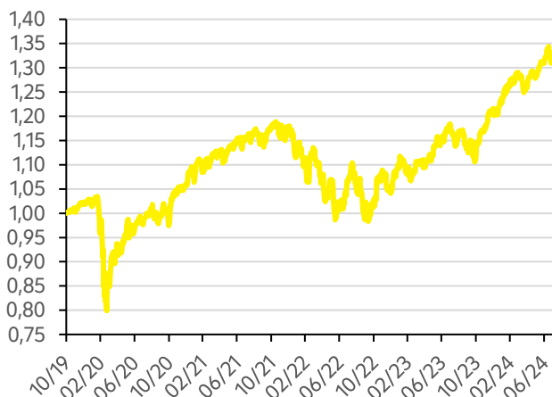
Vývoj hodnoty fondu FWR Strategy 60