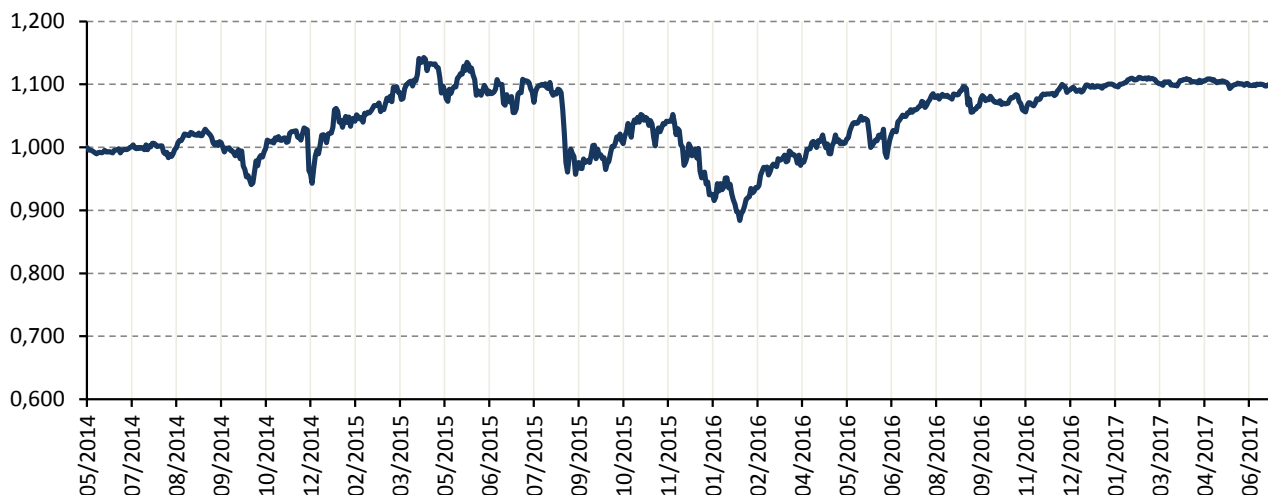
Vývoj hodnoty podílového listu fondu třídy A1